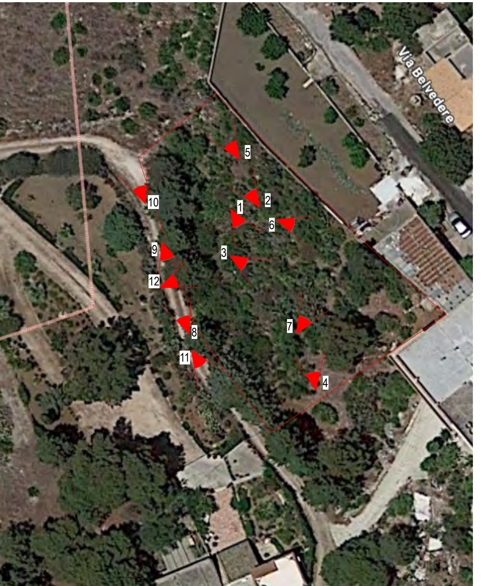
PLANIMETRIA CON INDICAZIONE DEI CONI OTTICI